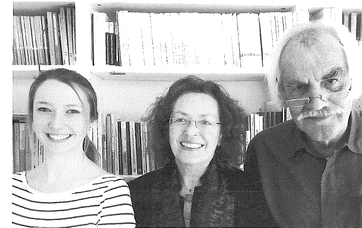
AUTOREN | Ellen SCHMIDT | Rosemarie KLEIN | Gerhard REUTTER

Ellen SCHMIDT, Studierende im Bachelor of Arts des Studienganges Erziehungswissenschaft mit dem Schwerpunkt Bildungsmanagement und Bildungsforschung an der Technischen Universität Dortmund. Arbeitsschwerpunkte während des studienbegleitenden Praktikums bei bbb, Dortmund: Arbeitsorientierte Grundbildung, Autorin für Wissenstexte im Projekt wb-web ( https://wb-web.de/ ) für Lehrbeauftragte in der Erwachsenenbildung in Kooperation mit bbb und der Bertelsmann Stiftung. ellen.schmidt@tu-dortmund.de